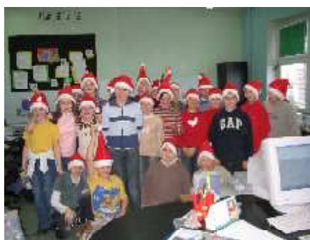
Klasa 4a po spotkaniu z Mikołajem

Tańczymy labada i Tajemniczy krok. Następnie dzieci z grup przedszkolnych, oddziałów zerowych i klas I – III zaprezentowały się płaśnianiem i piosenkami. Potem odbył się lot do Laponii na spotkanie z Mikołajem. Dzieci okrzykiem wywołały Mikołaja, który pojawił się wraz z orszakiem Śnieżynek. Wspólnie zatańczyli Lu-